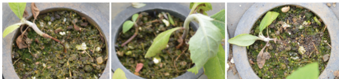
Figura 2. Tombamento de mudas jovens de Eremanthus erythropappus , causado por fungo do gênero Rhizoctonia . Figure 2. Damping off of Eremanthus erythropappus seedlings caused by Rhizoctonia .

Figure 1. a) Median survival of seedlings of candeia and eucalipto, at 145 and 110 days after sowing, respectively, due to the substrates different; b) Seedling survival of candeia at 145 days after sowing, depending on the percentage of cattle manure in the substrate. Médias seguidas da mesma letra, dentro da mesma espécie, não diferem estatisticamente pelo teste de Scott-Knott a 5% de probabilidade.